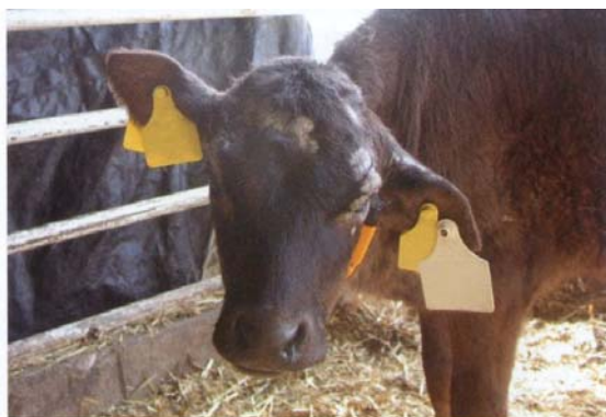
左側へ斜頸し耳介下垂、聴覚障害、眼瞼麻痺および角膜反射の低下を呈した68日齢の子牛