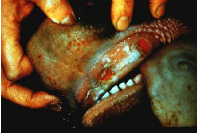
牛の舌・唇の水胞・びらん