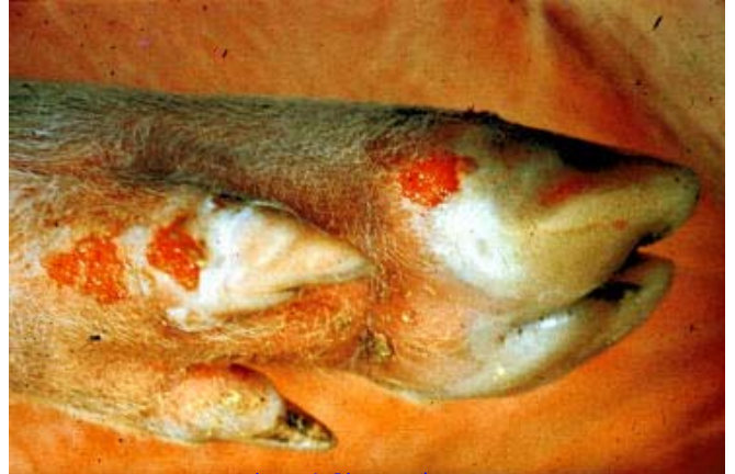
豚の蹄の水胞・びらん