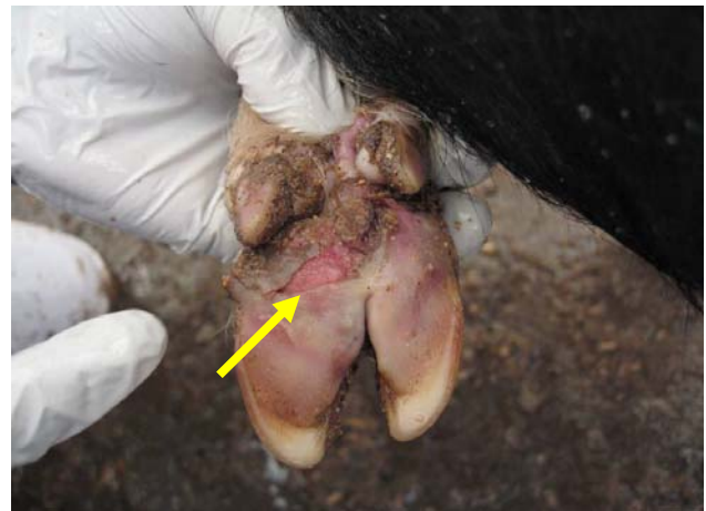
蹄部の水ぶくれの破れ