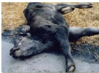
チュウザン病による神経症状