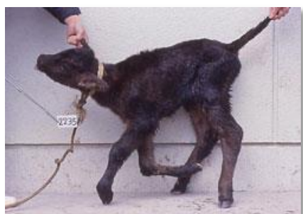
アカバネ病による関節の湾曲

熊本県では例年、農場におけるアルボウイルスの動きを調査していますが、昨年の城南家保管内で実施した調査では、アカバネウイルスの活発な動きが認められました。また、九州の他県においては、イバラキ病やアカバネ病の生後感染例も認められており、今後異常産の発生が危惧されています。異常産の予防には確実なワクチン接種が重要です。今年も母牛にワクチンを接種し、元気な子牛を生産しましょう。