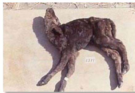
アイノウイルス感染症