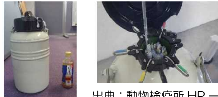
【例】一般的な精液や受精卵の輸送容器

和牛の精液や受精卵をお取り扱いの皆様におかれましては、上記についてご理解いただけますようお願いいたします。