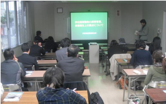
於：天草地域振興局

学校での動物の取扱い方法、消毒方法などの質問があり、皆さん熱心に聴講して頂くことが出来ました。