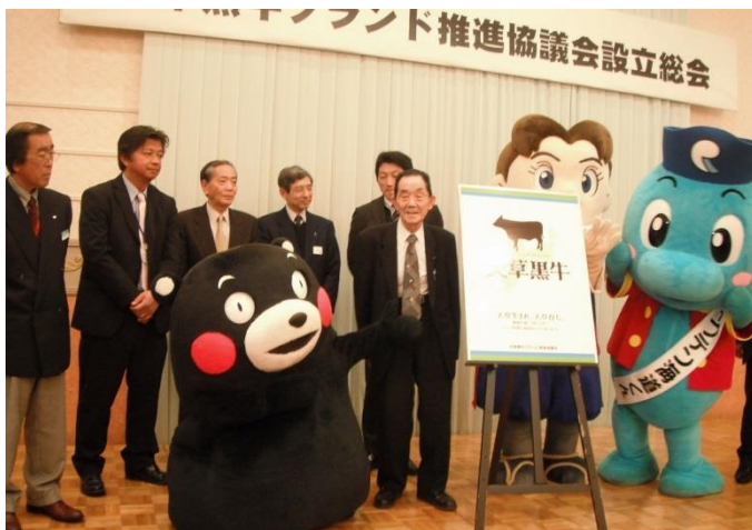
ブランドマークの発表

設立総会后、試食会が開催され、関係者約90名が「天草黒牛」の料理を堪能しました。試食会は観光や食品産業などとの連携を図るため、各観光協会、旅館組合、各商工会、天草郡市食肉組合が招待されました。また会場にはくまモンなどのゆるキャラも登場し、大いに盛り上がりました。