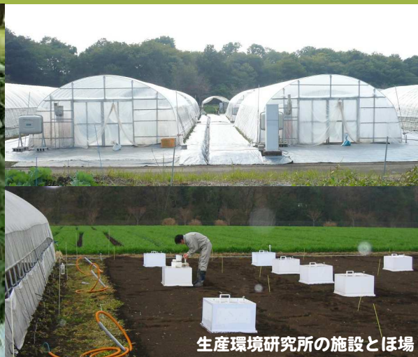
生産環境研究所の施設とほ場