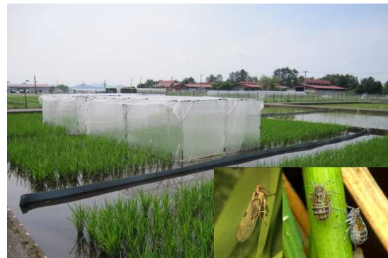
イネ南方黒すじ萎縮病の試験水田