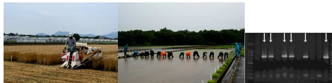
原原種の収穫 (シロガネコムギ系統 H24.6.6)