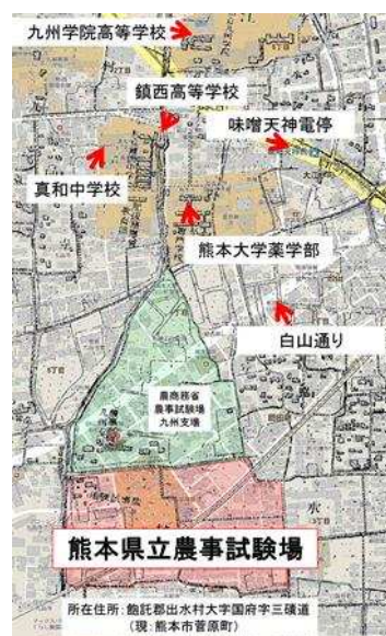
大正元年の地図 (背面は現在の地図)

当時の県内の農業は、米麦の栽培が中心であったため、試験研究もこれに関した内容が大半でした。