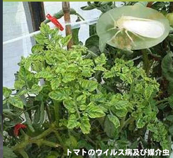
トマトのウイルス病及び媒介虫