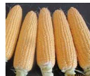
写真1 ゴールドラッシュ90