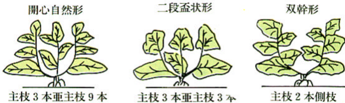
図1 改造後の目標樹形