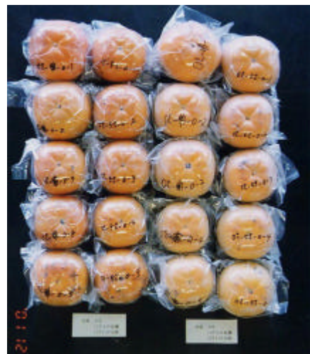
写真1 太秋貯蔵果実

注：1)1 で36日貯蔵 2)5(良)3(並)1(不良)の5段階評価 3)富有を基準：3とした 4)パネラーは果樹研究所職員34名