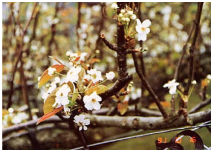
写真 不時開花状況