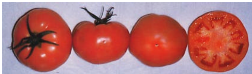
写真 2 天寿 5 号