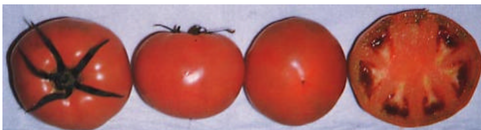
写真 1 天寿 1 号