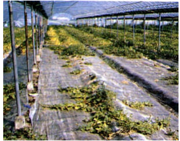
写真 メロン（ホームラン）の濃度障害