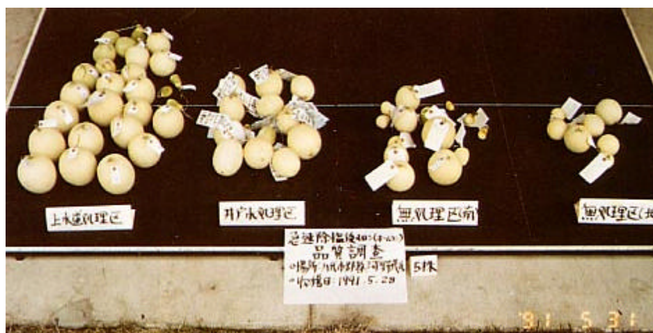
写真2 メロン（ホームランスター）の各処理区毎の5株の収量（各処理区は、上水道処理区に隣接している）