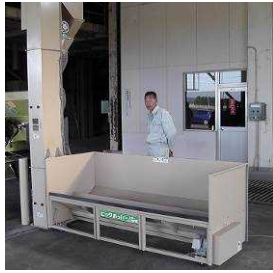
図 2 粃投入ホッパー