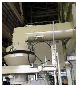
図 6 加水装置 (左) 加水部 (右)