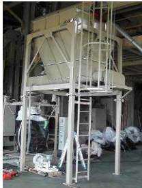
図 4 タンク