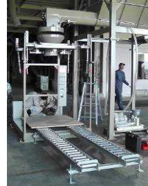
図 5 計量部