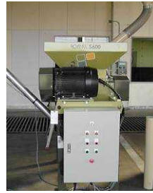
図 3 粉碎機