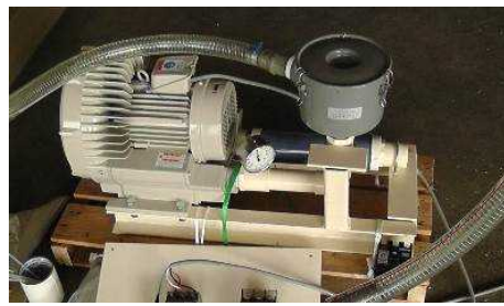
図 7 脱気装置