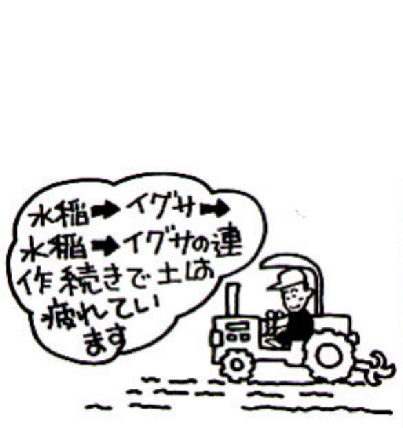
図3 規模拡大に伴う長期連作