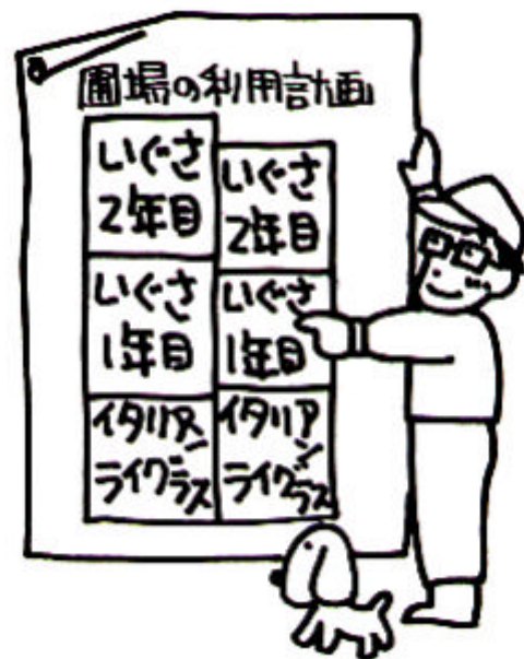
図4 いぐさ田の土地ローテーション(地力維持向上対策)