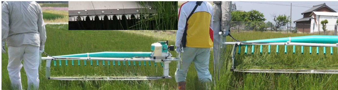
写真3 試験機(可搬式茶摘採機を改良したいぐさ先刈り機)による先刈り作業 エンジンは機械の片側に設置されているため、エンジンの始動操作は容易だが、エンジン側が重い。 (全重：20 kg (エンジン側 13 kg、反対側 7kg)) (写真上：試験機の刈刃(バリカン刃))