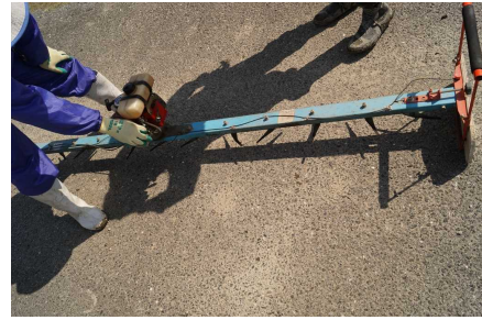
写真2 いぐさ先刈り機始動の様子 エンジンが機械の中心部にあるため、重量バランスは良いが、エンジン始動時には多数並んでいる刈刃をまたがなければならない。