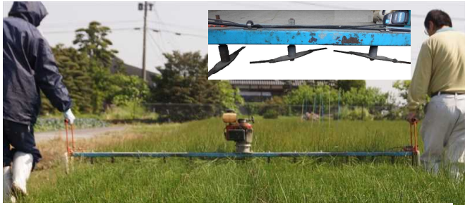
写真1 いぐさ先刈り機による先刈り作業 エンジンが機械の中央部にあるため、左右への重量配分はほぼ均等である。 (全重：18 kg (左 9.0 kg、右 9.0 kg)) (写真上：現行機の刈刃(回転刃))